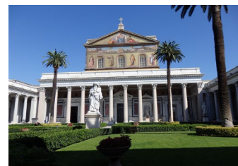
St Paul hors-les-Murs