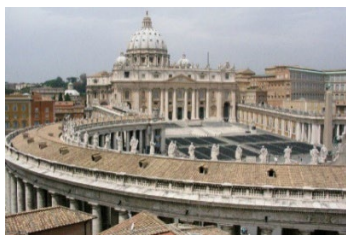
St Pierre - Vatican