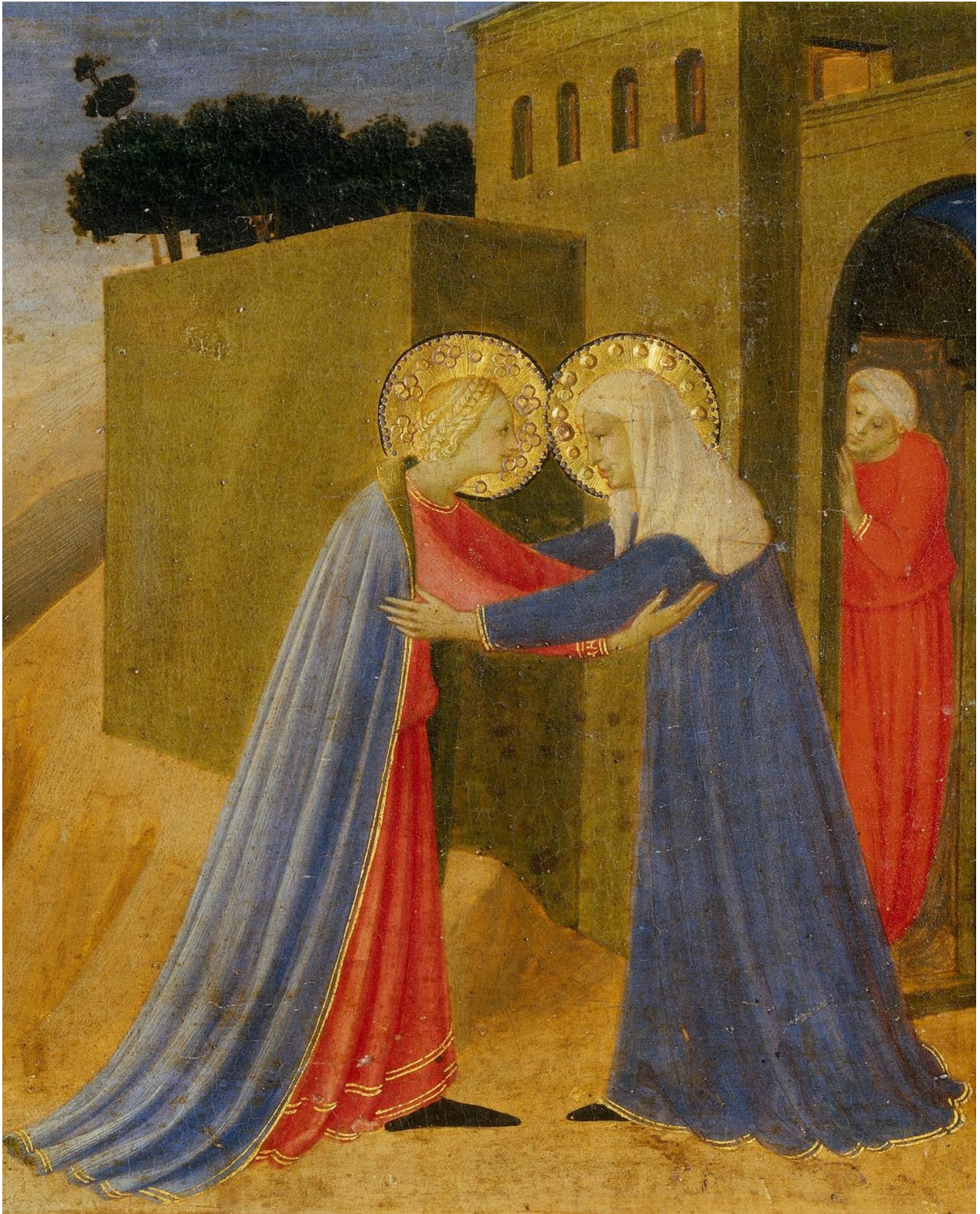
Visitation, Fra Angelico