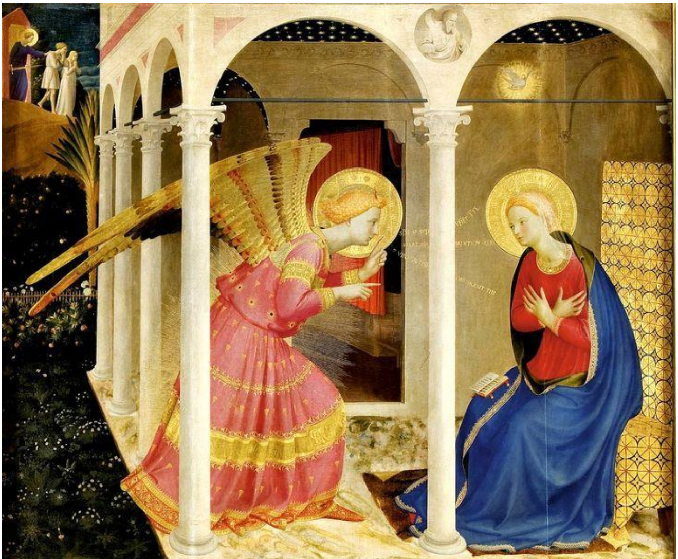
Annunciation, Fra Angelico