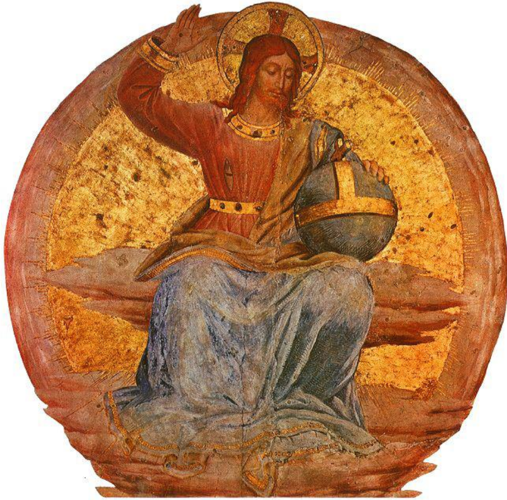
Christ en majesté, Fra Angelico