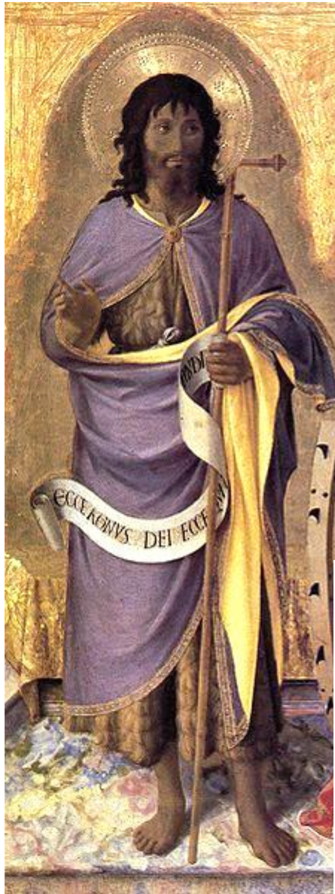
Saint Jean-Baptiste, Fra Angelico